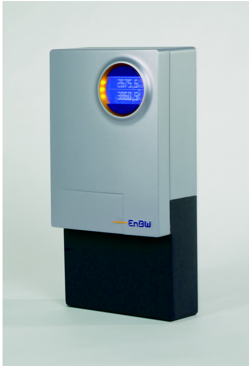
Stromzähler der EnBw